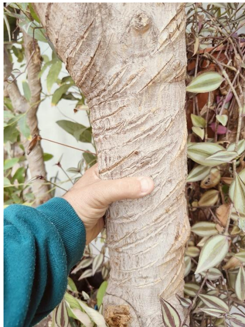
Planta con 20 años de edad. Cicatrices que curan a cientos de personas.

La aparición del virus del tungo de arroz y el virus de mosaico de Chilli en las regiones del sur de África y el sur de Asia se controlaron con el extracto de la hoja de Euphorbia Umbelata Pax al 10% de concentración